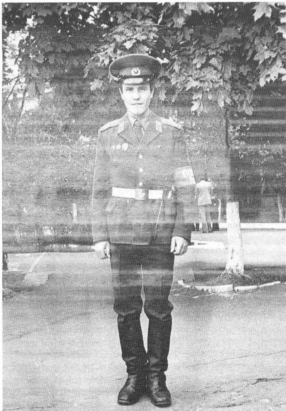
Служба в Военно-Воздушных Силах г. Пушкин, 1982 год