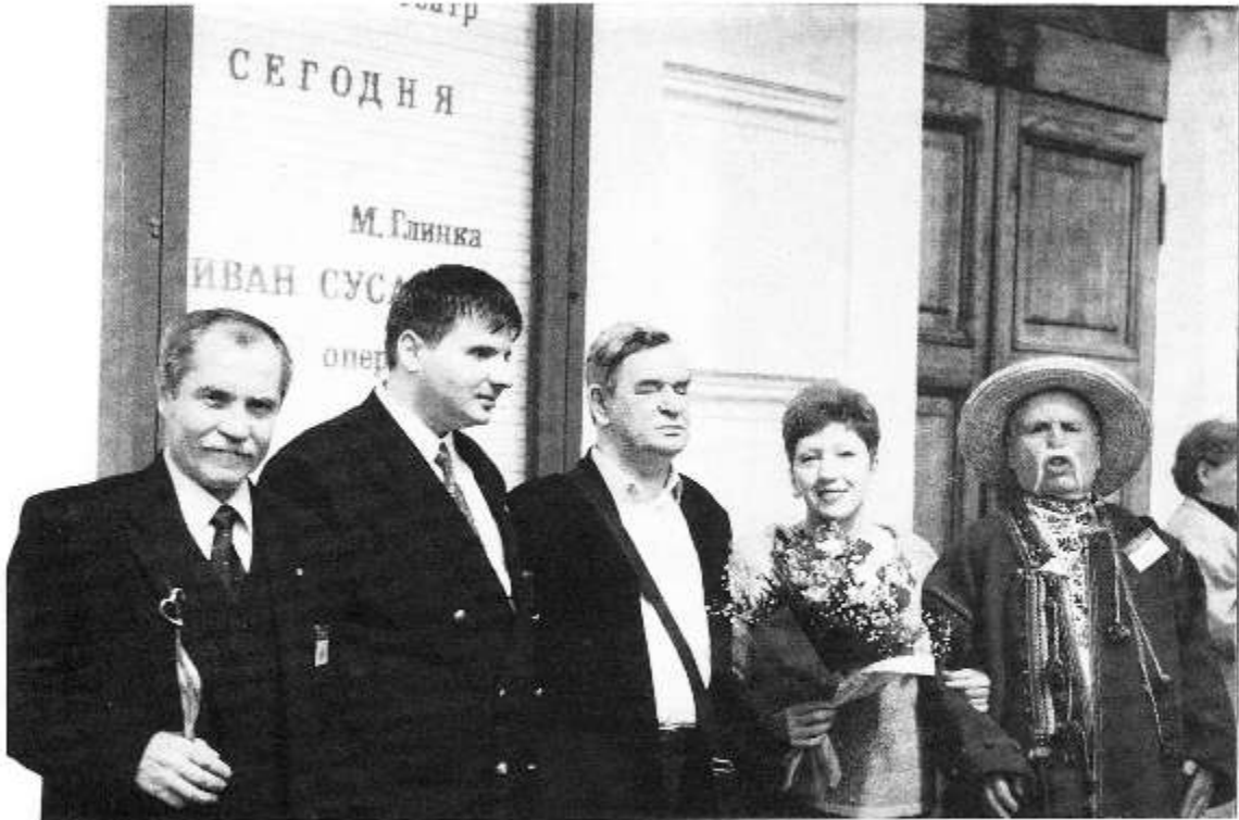
У Большого театра после вручения Международной премии "Филантроп". г. Москва, 15 мая 2002 года.