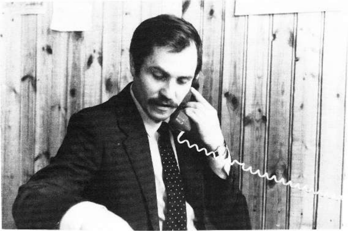
В редакции районной газеты "Авангард" 80-е годы