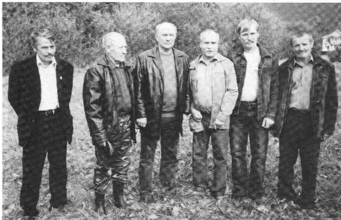
Губернатор В.Е. Позгалев в д. Березово 30 августа 2007 года