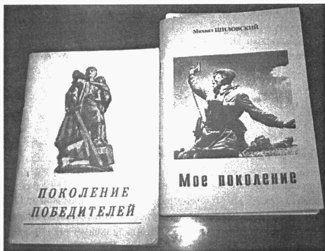
О боевых дорогах М.Е. Шиловского и других наших земляков расскажут книги

Материалы подготовила Галина СУРИНА. Фото автора.